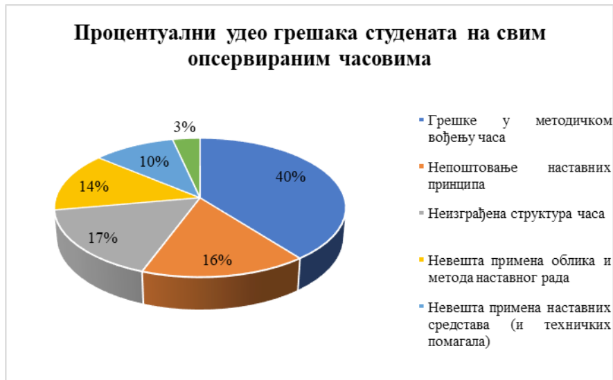
Графички йриказ 7. Процентуални удео грешака студената на йривљених на опсервираним испйййним часовима.