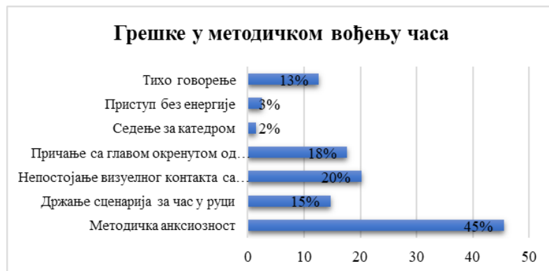
Графички приказ 2. Процентуални удео грешака у методичком вођењу часа.