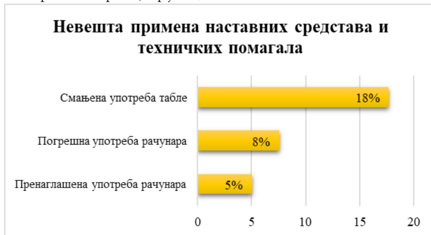
Графички йриказ 6. Процентуални удео йрешака настйалих услед невешйе йримене настйавних средстйава и шехничких йомајала.