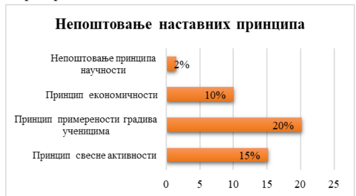
Графички приказ 3. Процентуални удео грешака йроузрокованих непоштовањем наставних принципа.

гове примене у пракси. Логично је да се, на пример, приликом обраде гласовних промена прво обради класификација гласова у српском језику, па онда свака гласовна појава појединачно, или да се приликом објашњавања типова творбе у српском језику најпре објасни термин йородица речи и њена функција, па тек да се онда разговара о различитим моделима.