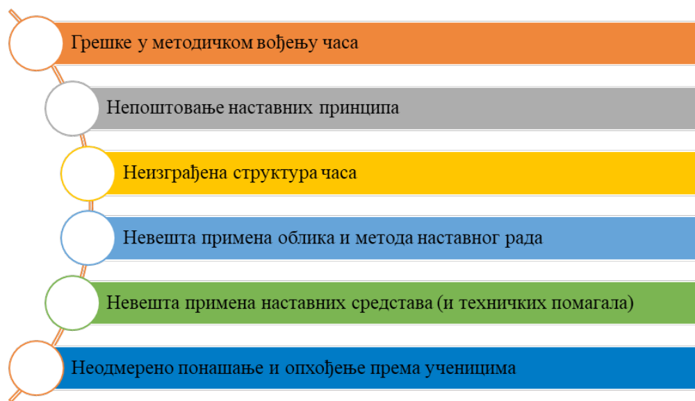
Графички приказ 1. Појис најчешћих грешака студената на практичним часовима српског језика.

Приликом истраживања коришћена је метода теоријске анализе, односно дескриптивна метода коју прати квалитативна и квантитативна обрада добијених резултата, као и метода опсервације. Технике којима су се аутори служили приликом реализације истраживања јесу анализа садржаја и интервју.