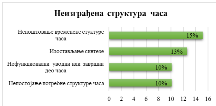
Графички приказ 4. Процентуални удео грешака насталих услед неизграђене структуре часа.

лошка, анализа примера, извођење особина изучаване појаве, постојање фазе осигурања знања и синтезе, тј. генерализације (оперативни део часа); стваралачка примена знања и давање домаћег задатка у оквиру евалутивног дела (завршни део часа). Међутим, пракса показује да студенти (у мањем броју) греше у свим етапама часа. Тако, на 10% опсервираних часова или на часовима двадесет студената долази до појаве нефункционалног уводног или завршног дела часа . На пример, коришћење асоцијације, као вида игралике наставе, никако не значи да ће, према подразумеваном, уводни део часа бити функционалан: биће уколико се приликом обраде палатализације асоцијација искористи за понављање градива о подели сугласника, а неће бити ако се асоцијација користи само за (обичну) игру. Такође, честа је појава да студент након мотивације и најаве нове наставне јединице обнавља део градива који је потребан за усвајање новог. На тај начин се ремети мисаони ток ученика, јер све што је потребно поновити треба обновити у уводном делу часа. Дакле, након најаве наставне јединице не би требало понављати претходно савладано градиво, осим у изузетним случајевима. Уз то, као неизоставна фаза приликом најаве нове наставне јединице јавља се истицање циља